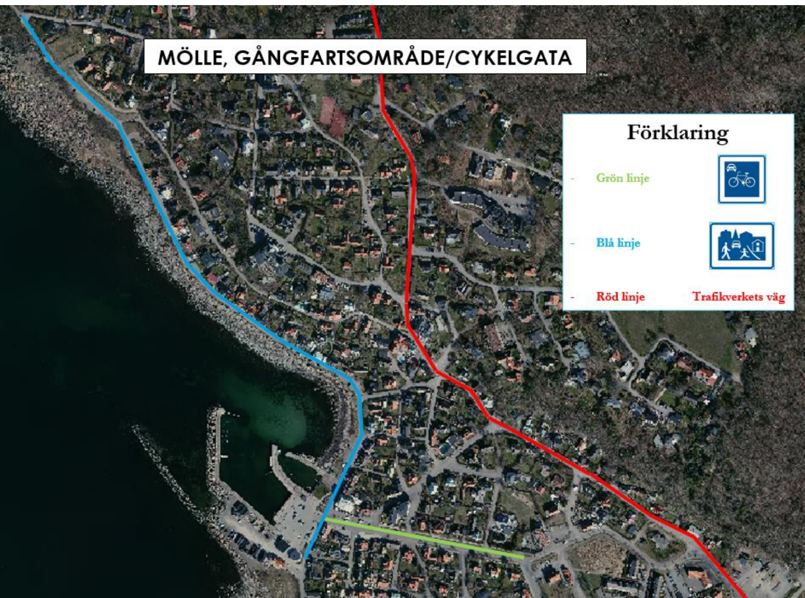
Figur 2: Förslag på reglering, Norra och Södra Strandvägen blir gångfartsområde medan Gyllenstiernas Allé blir cykelgata. Väg 111 tillhör Trafikverket och kommer inte anpassas.