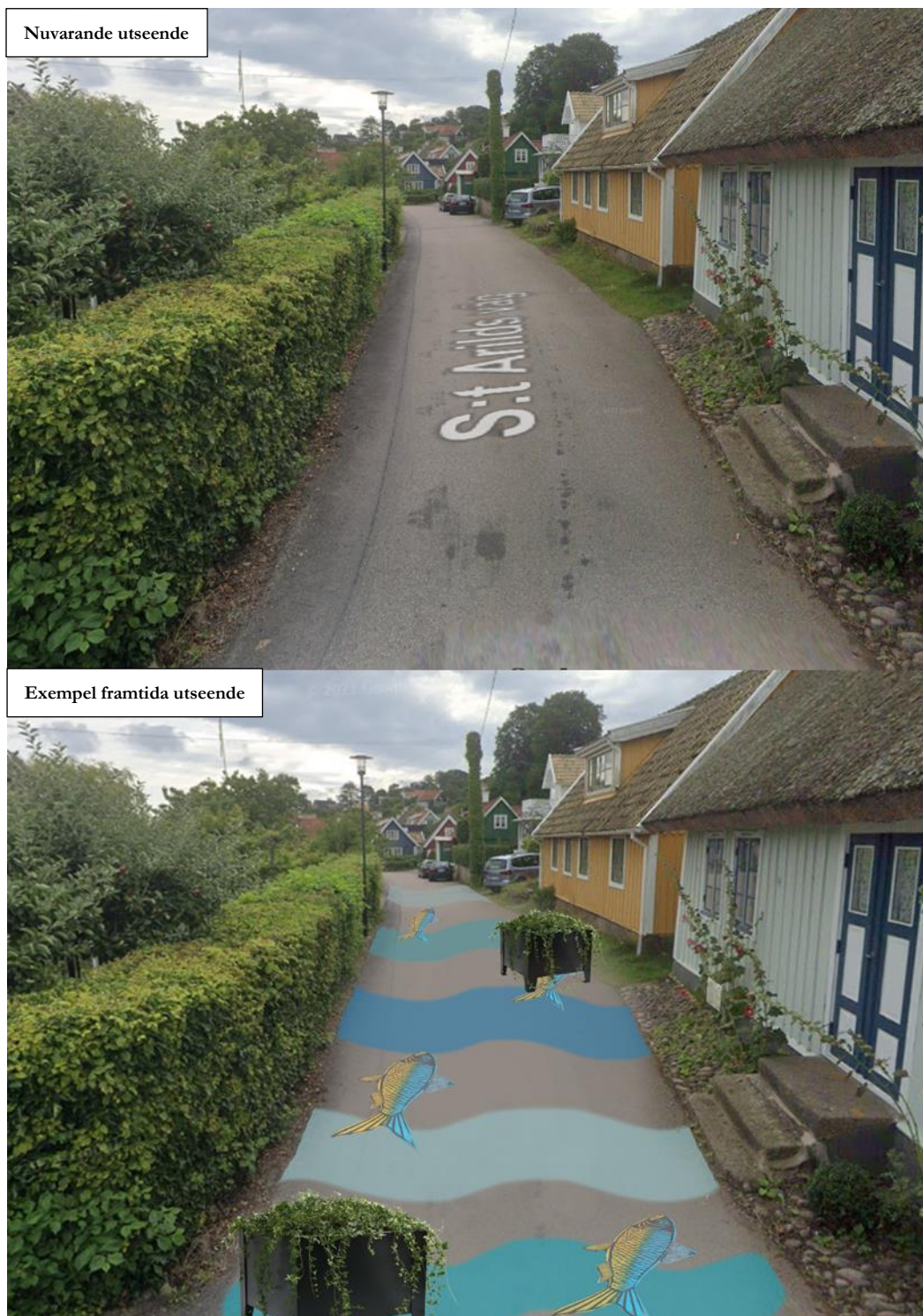
Figur 4: Exempel på målning längs S:t Arilds Väg.