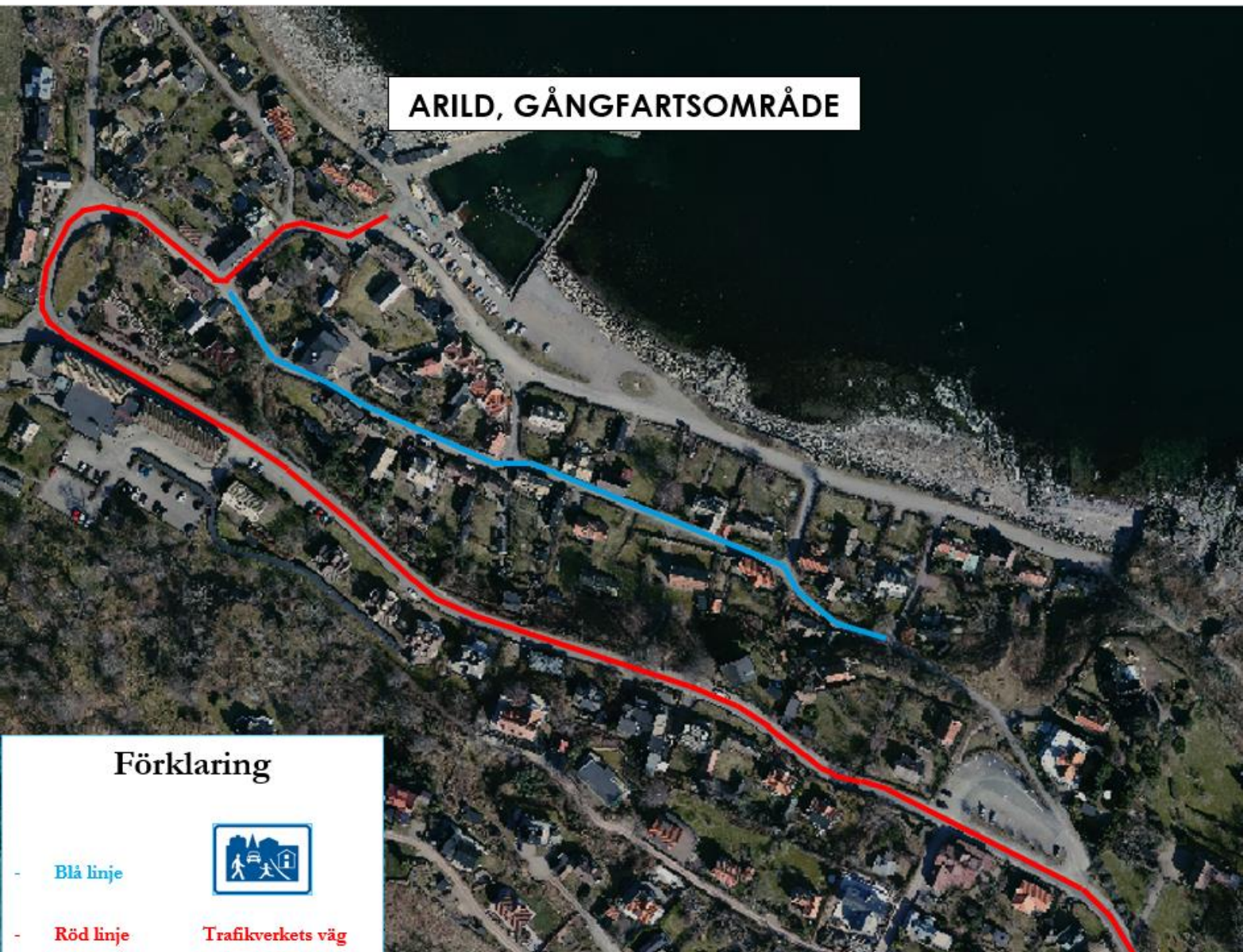
Figur 1: Förslag på gångfartsområde längs S:t Arilds väg i blå färg. Stora Vägen är Trafikverkets väg och kan inte förändras, denna har röd färg på kartan.